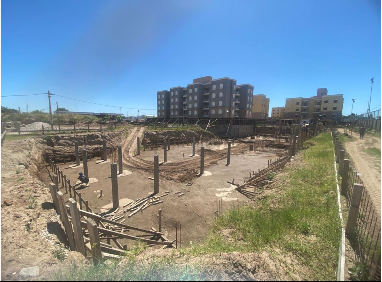
Excavación con bases del subsuelo