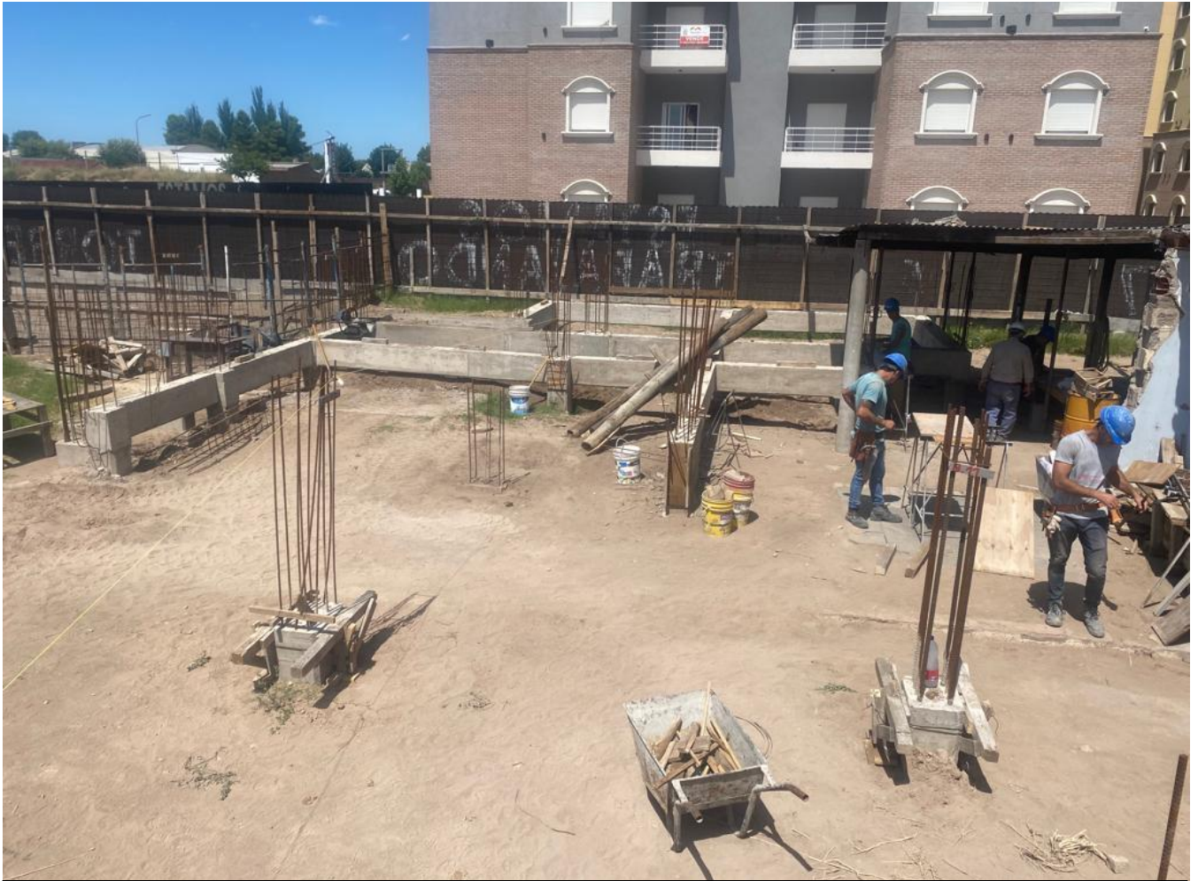
Vigas de Arriostre sobre planta baja